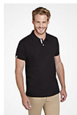
SOL'S PORTLAND MEN 00574